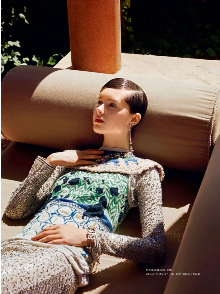
针织连衣裙、耳环、手镜 all from CHANEL "巴黎·纽约"高级手工坊系列