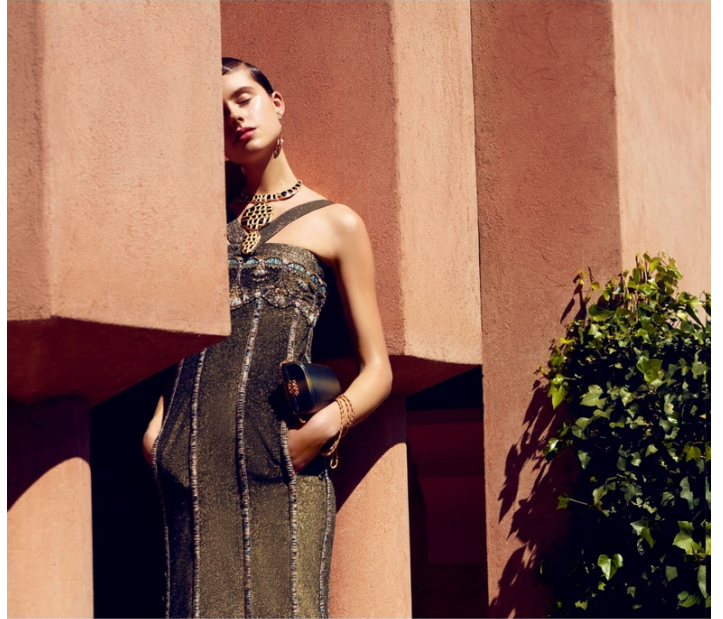
刺绣连衣裙、鳞片效果项链、耳环、包 all from CHANEL "巴黎·纽约"高级手工坊系列