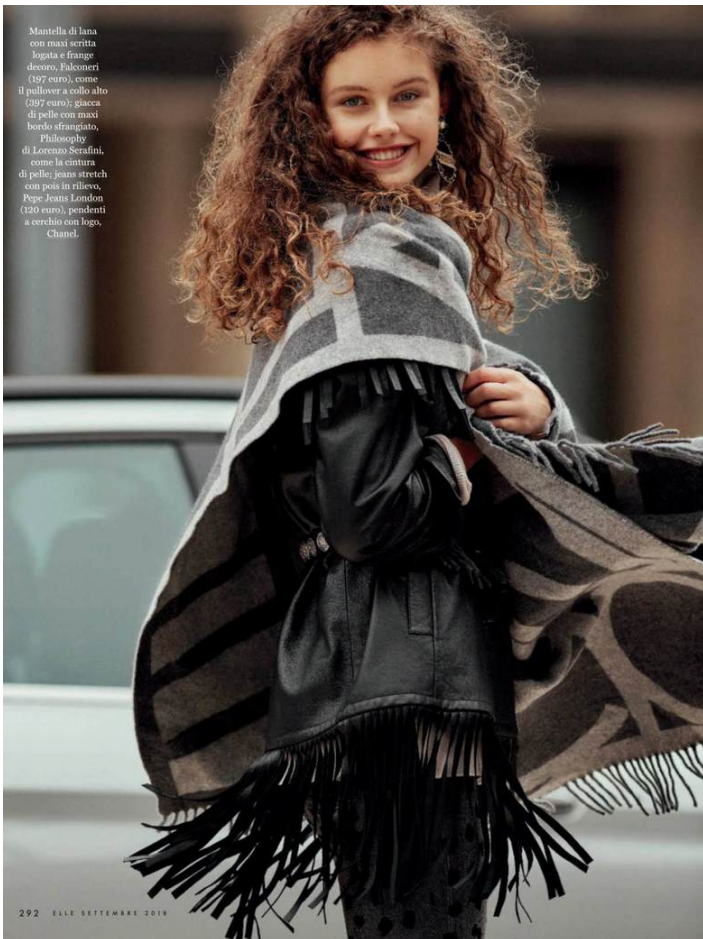
Mantella di lana con maxi scritta logata e frange decoro, Falconeri (197 euro), come il pullover a collo alto (89 euro); giacca di pelle con maxi bordo sfrangiato, Philosophy di Lorenzo Serafini, come la cintura di pelle; jeans stretch con pois in rilievo, Pepe Jeans London (120 euro); pendenti a cerchio con logo, Chanel.